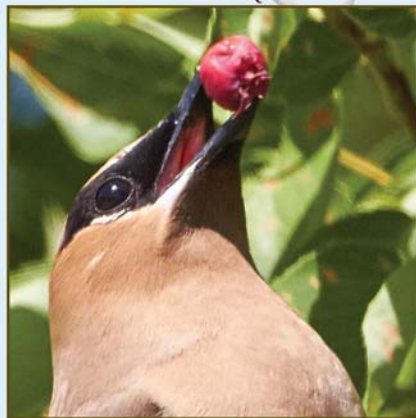
▲ UN JASEUR D'AMÉRIQUE QUI MANGE UNE BAIE D'AMÉLANCHIER

➤ Déplacez les plantes d'intérieur loin de vos fenêtres et installer des stores à lattes et les tourner en position ouverte pendant le jour. Les oiseaux voient les plantes d'intérieur comme un endroit où se percher ou se réfugier, mais ils ne voient pas la vitre qui se trouve devant.