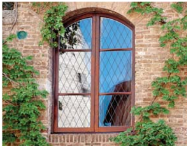
▲ LA PELLICULE POUR FENÊTRE SOLYX

les petits oiseaux tels que les colibris et les parulines en sécurité, une fenêtre ou une section vitrée ne doit pas avoir de surface réfléchissante plus large que 5 x 5 cm (2 x 2 pouces).