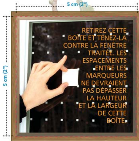
▲ LE RUBAN RÉSIDENTIEL FEATHER FRIENDLY®